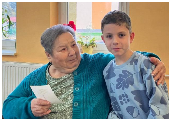
Klientka Dolního domova se svým pravnukem

Naši klienti mají smysl pro humor. Při přípravě programu na setkání 8. října jsme se domluvily s šesti klientkami a připravili společně pro děti malé dobrodružství. Z dětí se na chvíli stali detektivové, kteří pátrali a snažili se podle fotografie nalézt mezi klientkami právě tu dámu, které fotografie z mládí patří. Tato hra na detektivy pak byla inspirací i pro příští setkání, děti si na ně přinesly svou fotografii a role se obrátily.